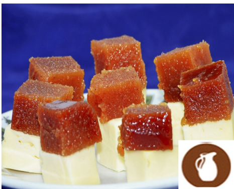
QUESO CON MENBRILLO 4,50 €