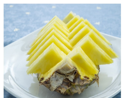
PIÑA NATURAL 4,00 €