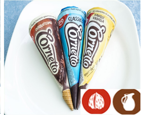
CORNETTO FRIGO 1,75 €