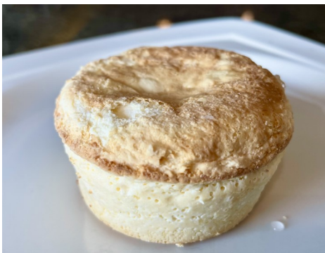
COULANT BLANCO SIN GLUTEN 5,50 €