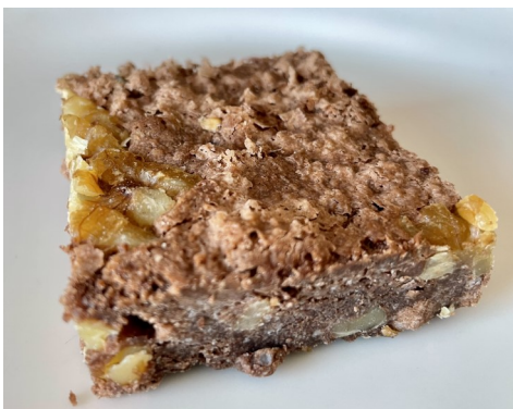
BROWNIE DE CHOCO CON NUEZ 5,00 €