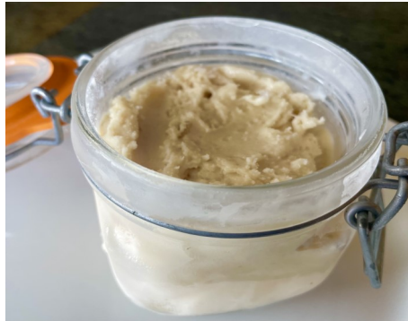
HELADO DE PASAS AL RON 4,50 €