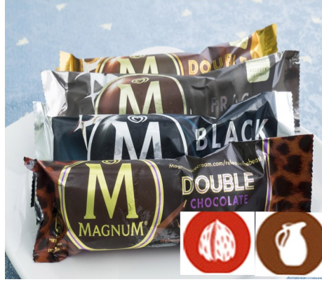
MAGNUM FRIGO 2,75 €