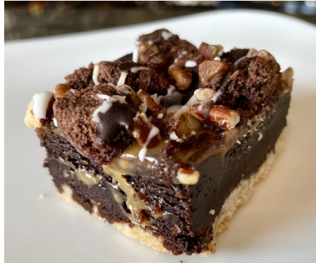
BROWNIE CON CARAMELO 5,90 €