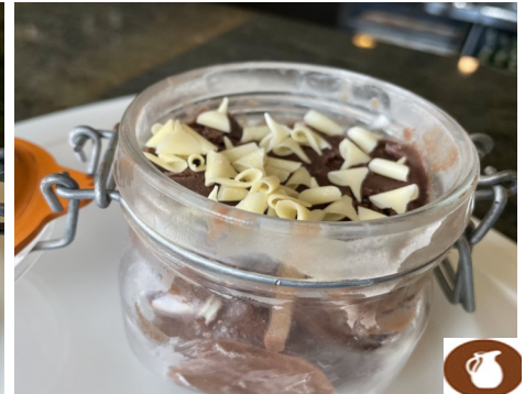
HELADO DE CHOCOLATE 4,50 €