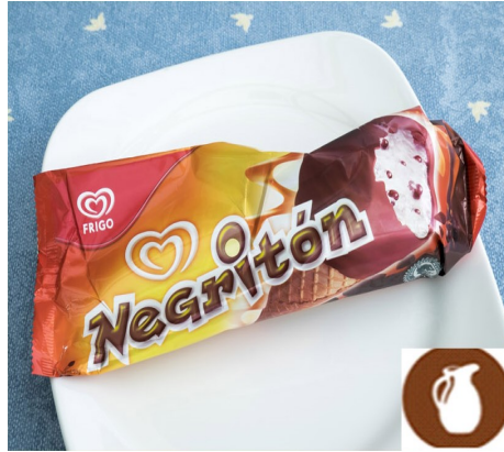
NEGRITÓN 2,50 €