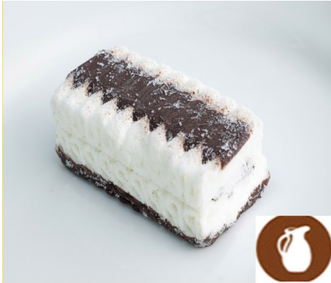
TARTA HELADA FRIGO 3,90 €