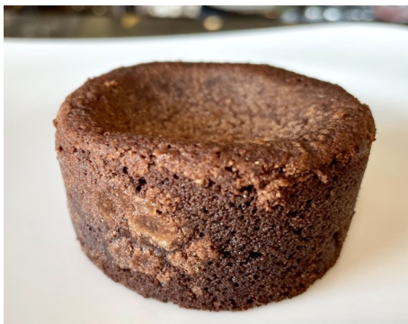
COULANT CHOCOLATE 5,50 €