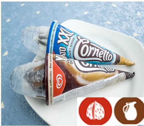
CORNETTO XXL FRIGO 2,75 €