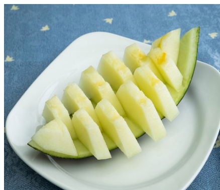
MELÓN NATURAL 4,00 €