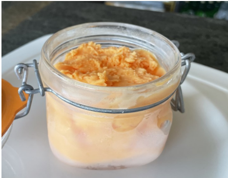
HELADO DE MANDARINA 4,50 €